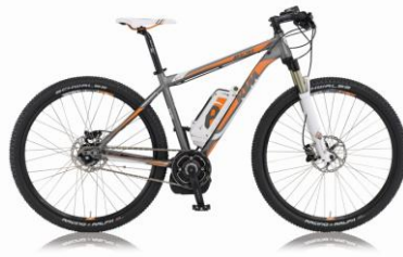
Abbildung: Macina 29

Im Preis inklusive ist das 1 Jahr Sorglospaket, es beinhaltet: