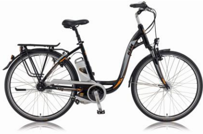
Abbildung: Amparo 8